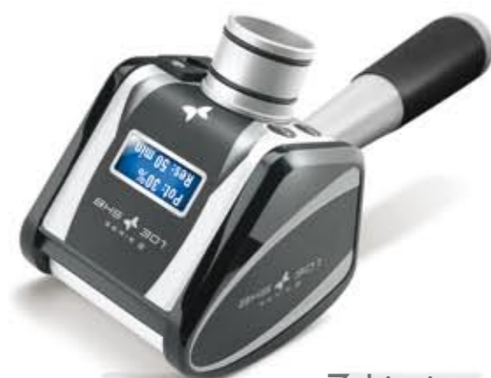
Głowica BHS 301 w działaniu.

Nowoczesna głowica ssąca z ruchomymi rolkami stymuluje do działania strukturę skóry i podskórne, aktywuje krążenie limfatyczne, żyłne i tętnicze.